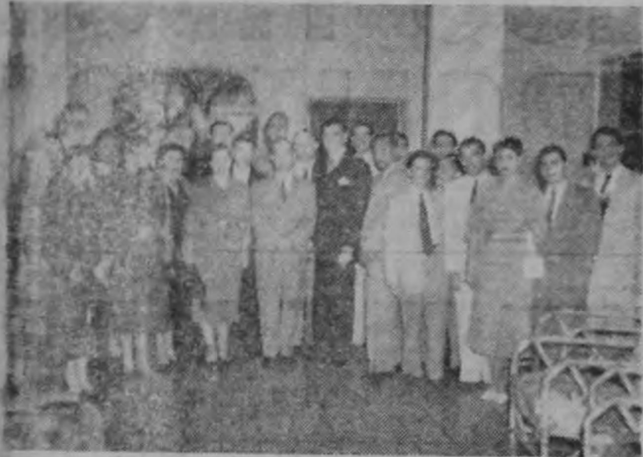
El señor Presidente de la República don José Figueres rodeado de los técnicos de extensión agrícola de 11 países latinoamericanos que lo visitaron ayer en la Casa Presidencial.

Representante de los Clubes 4-S, una estimable profesora, costarricense, especializada en el exterior en cursos de extensión agrícola explicó, a pedido del señor Figueres, las conexiones internacionales de ese grupo, con STICA y el Punto IV. Los Clubes 4-S han hecho en Costa Rica una gran labor educacional en todos sus aspectos. El señor Presidente alabo la vocación de los miembros de esos grupos, comparándolos con verdaderos Misioneros de una cruzada social de suma trascendencia hemisférica.