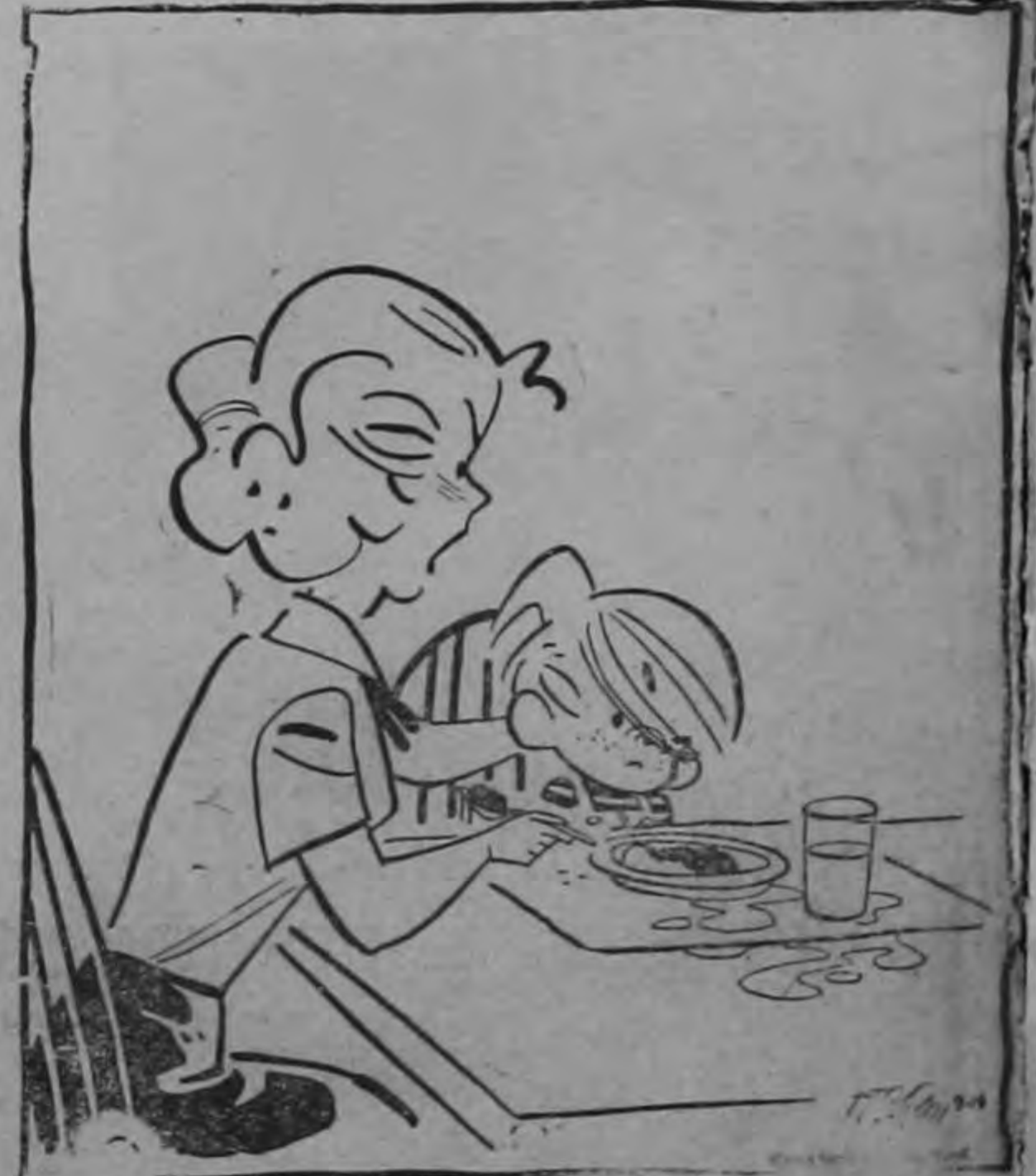
Yo dije que no insistiría en que terminaras el almuerzo. Yo no dije que no te lo haría tragar a la fuerza...